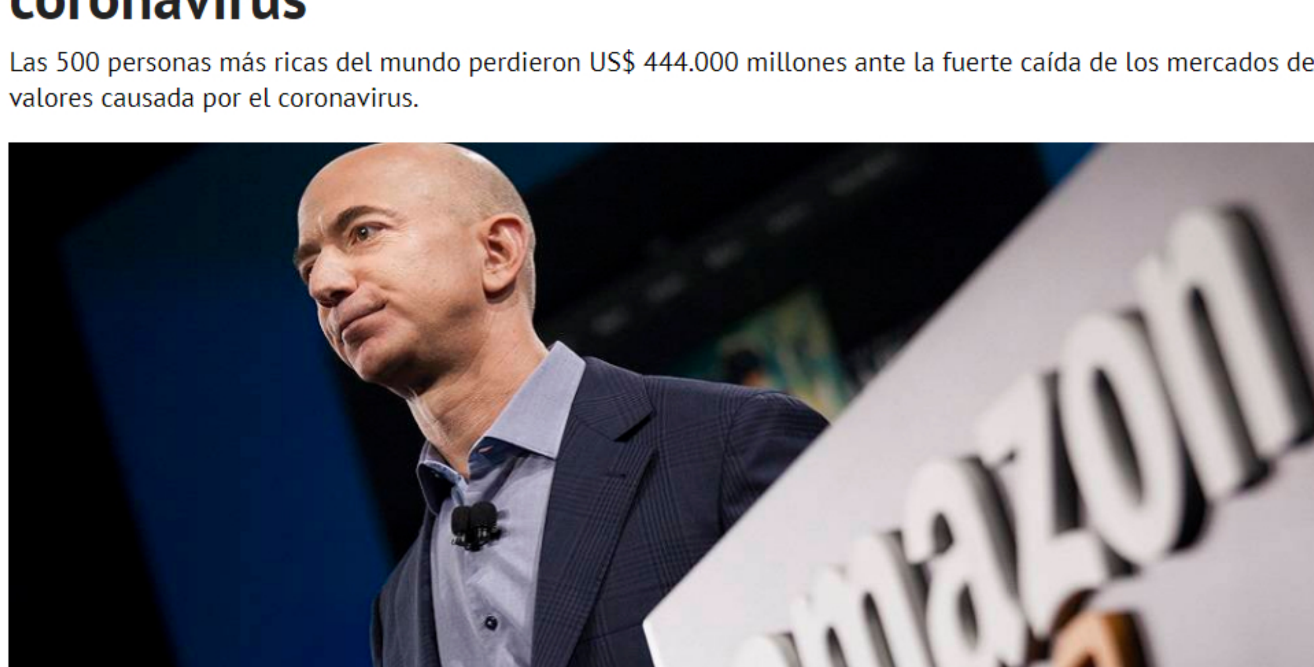
📷 Multimillonarios: también afectados por el coronavirus

Las 500 personas más ricas del mundo perdieron US$ 444.000 millones ante la fuerte caída de los mercados de valores causada por el coronavirus.