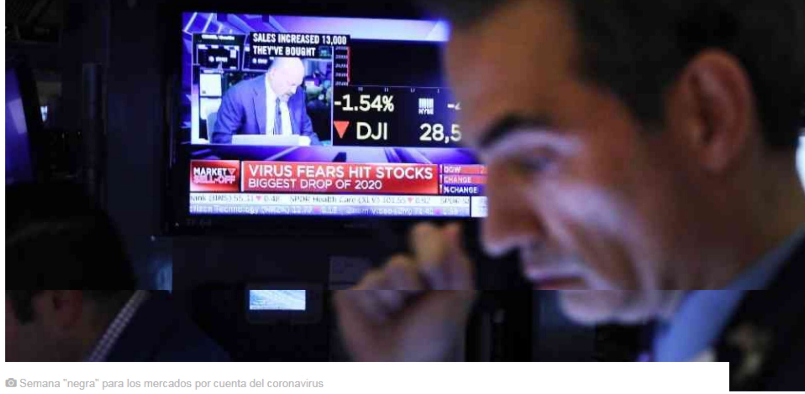
📷 Semana "negra" para los mercados por cuenta del coronavirus

El dólar alcanzó nuevos máximos históricos, la bolsa colombiana se redujo un 5% y el petróleo vivió su peor semana desde la crisis financiera de 2008. ¿Seguirá el derrumbe de los mercados?