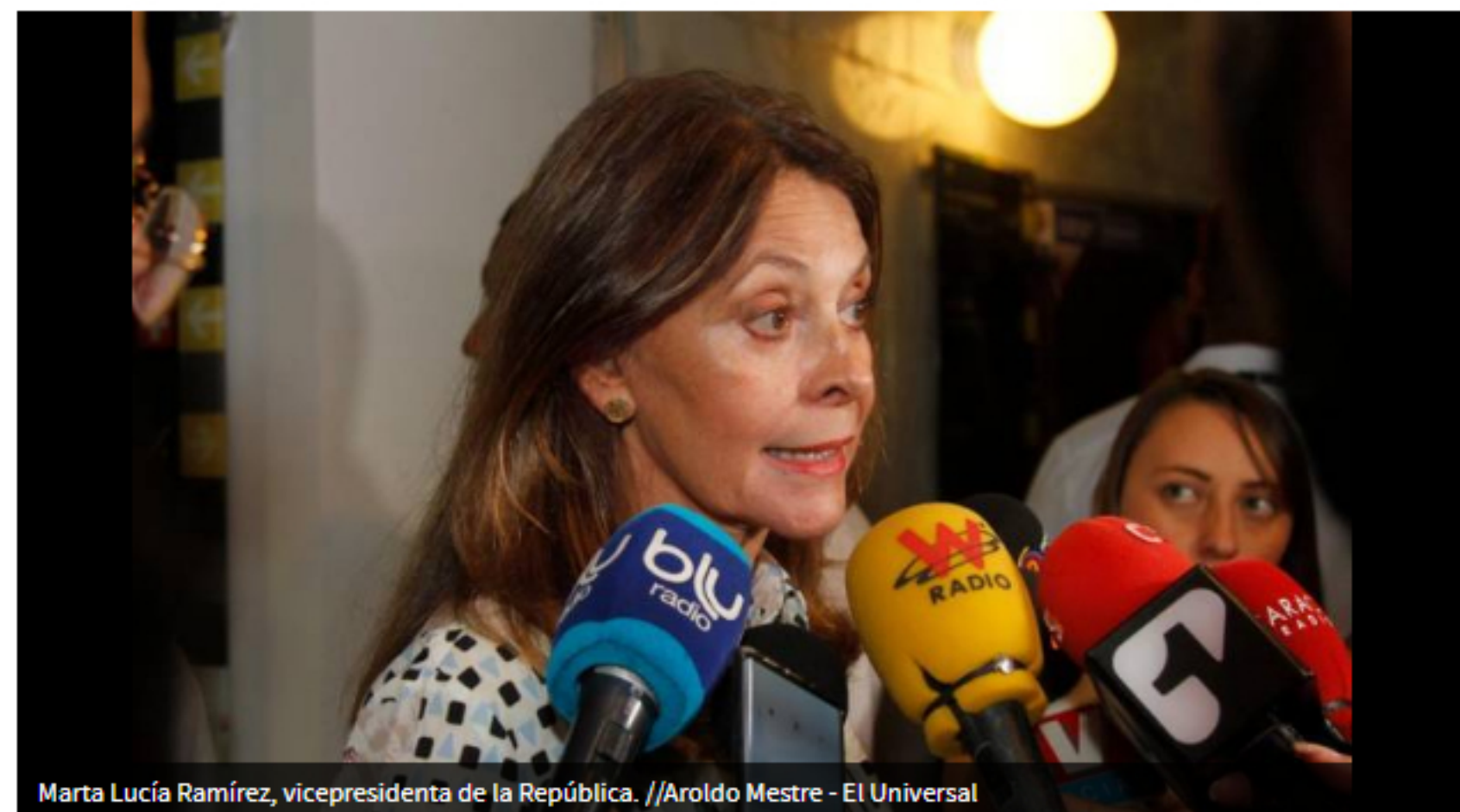
Marta Lucía Ramírez, vicepresidenta de la República.