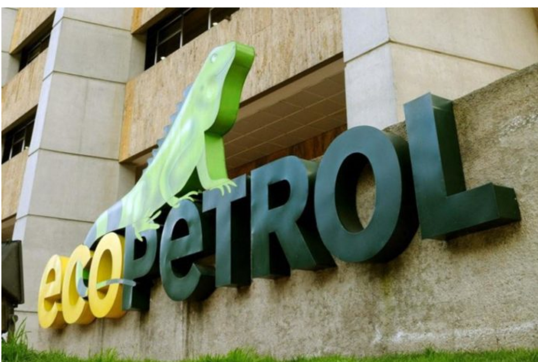
La petrolera adquirió bienes y servicios por $874.000 millones en la regional y abrió nuevos mercados para sus proveedores en otras zonas donde tiene operación por $682.000 millones más.

Ecopetrol , en su compromiso con el desarrollo y progreso de las regiones donde opera, generó una contratación de bienes y servicios por $1,6 billones con proveedores oriundos de la Regional Central, compuesta por ocho departamentos.