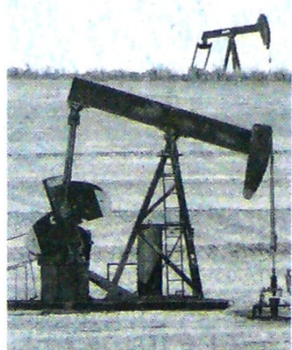
El precio terminó ayer en US$54,33 por barril.

Pero este mal comportamiento no es exclusivo del Brent, sino que la referencia WTI ha seguido la misma línea. Al terminar el día de ayer su precio se estable-