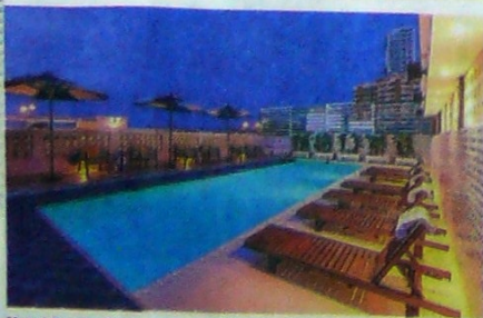
Hotel Ermita Cartagena, en el barrio El Cabrero.