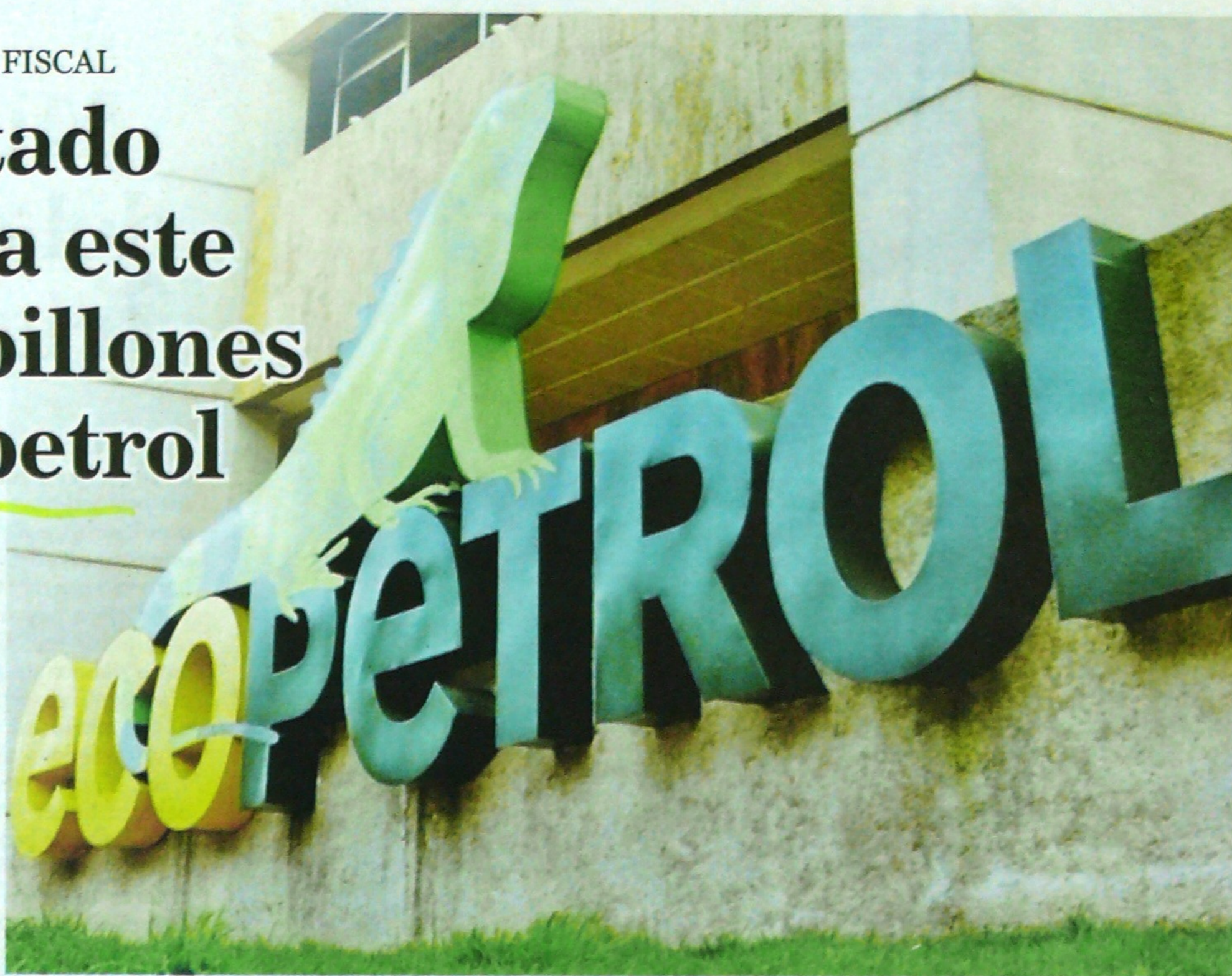
UN BALÓN de oxígeno dará Ecopetrol al Estado con las ganancias registradas en el 2019.

Por otro lado, la devaluación del peso y la continuidad de su programa de eficiencias fueron los factores principales que llevaron a la empresa a elevar las ventas totales en 2019. De