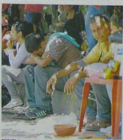
CÚCUTA lleva años incrementando el rango de condición de pobreza, por la presencia de migrantes venezolanos, según el Dane.

como para las agencias internacionales, fundaciones y demás entidades que le tienden la mano a la población migrante.