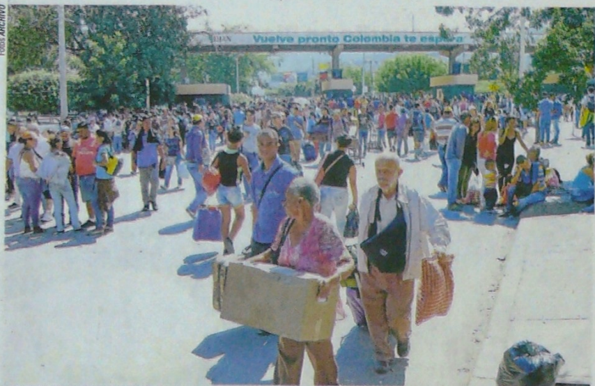
LOS PUENTES INTERNACIONALES Francisco de Paula Santander y Simón Bolívar son los pasos obligados del mayor flujo migratorio de venezolanos hacia Colombia.