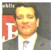
FELIPE BAYÓN PRESIDENTE DE ECOPETROL

Durante 2019 Ecopetrol logró consolidar resultados positivos a nivel financiero gracias, en gran medida, a la consolidación del programa de eficiencias a nivel interno y a la internacionalización de sus negocios. Uno de ellos: el ingreso a Permian en Estados Unidos.