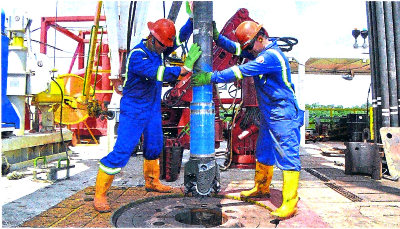
La producción local llegó a los 725.000 barriles en promedio día, que representa 5.000 bpd más a lo extraído en 2018. CEET