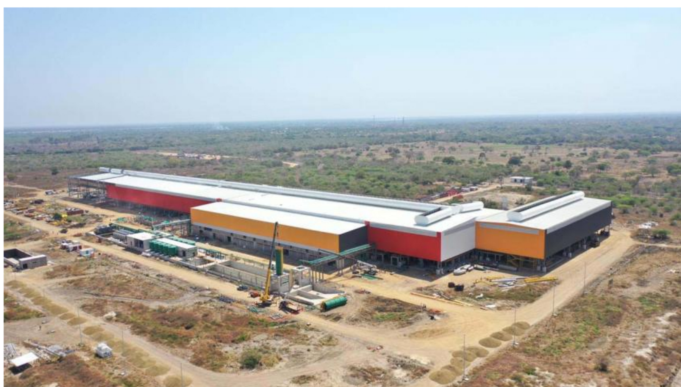
Panorámica de la planta de Ternium ubicada en Palmar de Varela.