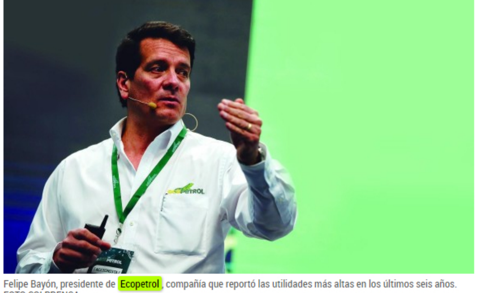
Felipe Bayón, presidente de Ecopetrol , compañía que reportó las utilidades más altas en los últimos seis años.

COLOMBIA | ECOPETROL | RESULTADOS EMPRESARIALES