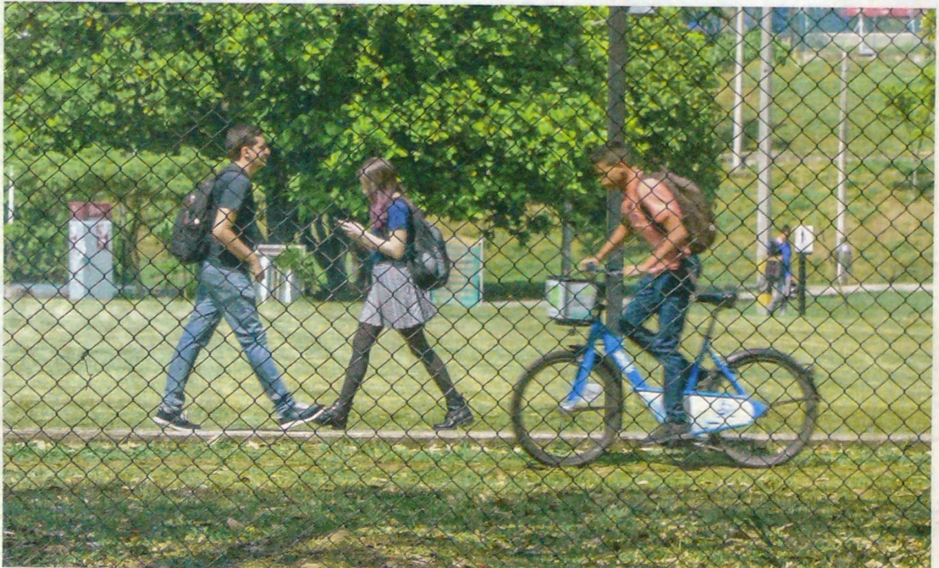
Eliminar las rejas de los campus universitarios, el Parque Norte y el Jardín Botánico para integrarlos como espacio público a Medellín es la propuesta de los gobernantes regionales. Seguridad y patrimonio preocupan a expertos. Evaluamos la iniciativa. PÁG. 2