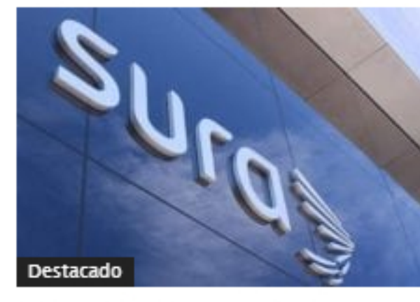
Grupo Sura constituyó nueva compañía en Uruguay