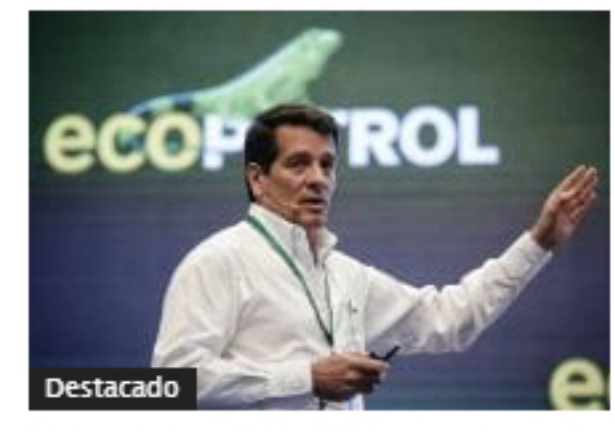
Este es el plan de negocios e inversiones de Ecopetrol entre 2020 y 2022