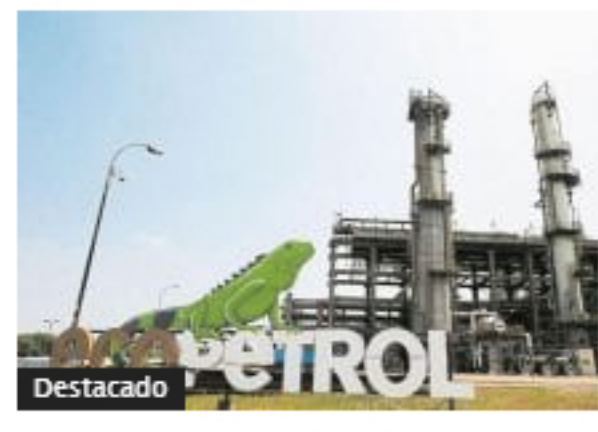
Ecopetrol alcanzó utilidad más alta en seis años, Ebitda histórico y cumplió metas de producción