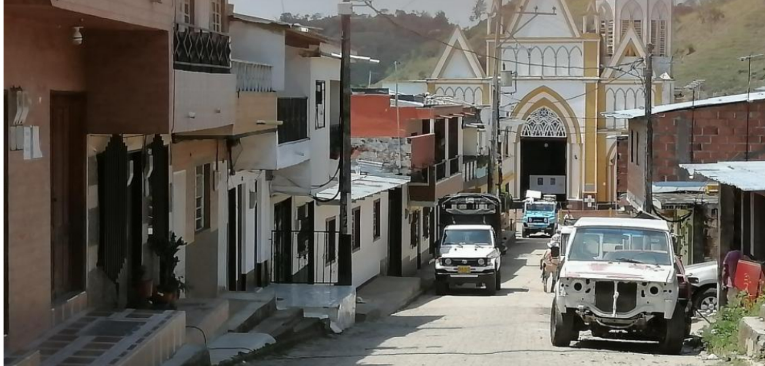
A escasos metros de la iglesia del corregimiento está la casa, que fue 'tomada' por 'Jota'.