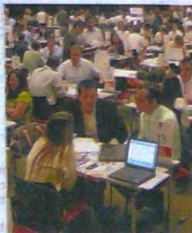
Epicentro Cluster se realizará en el Centro de Eventos Valle del Pacífico.

Los empresarios interesados en asistir a Epicentro Cluster, encuentran toda la información en la página web de la Cámara: www.ccc.org.co