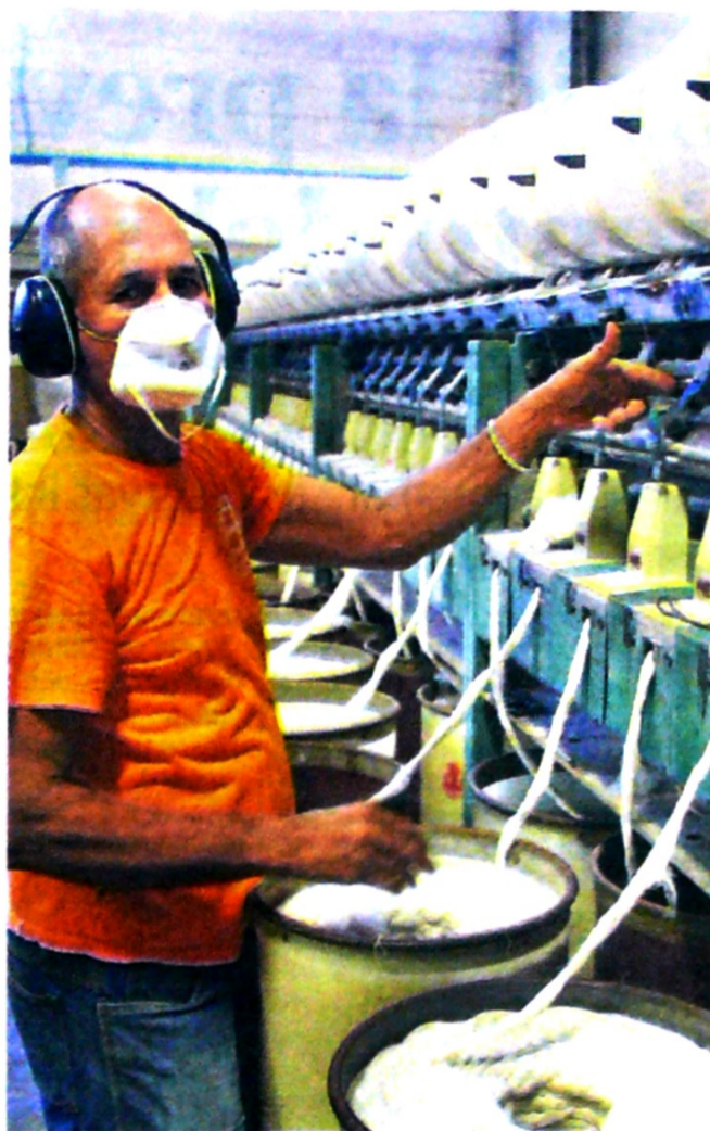
El gremio textilero no descarta las movilizaciones.

Así mismo, apuntó que el Gobierno, que se hizo elegir ofreciendo protección a la industria nacional de las confecciones mediante la aplicación de los máximos aranceles permitidos por la OMC, y que hoy le está dando la espalda a miles de operarias y a todo el sector.