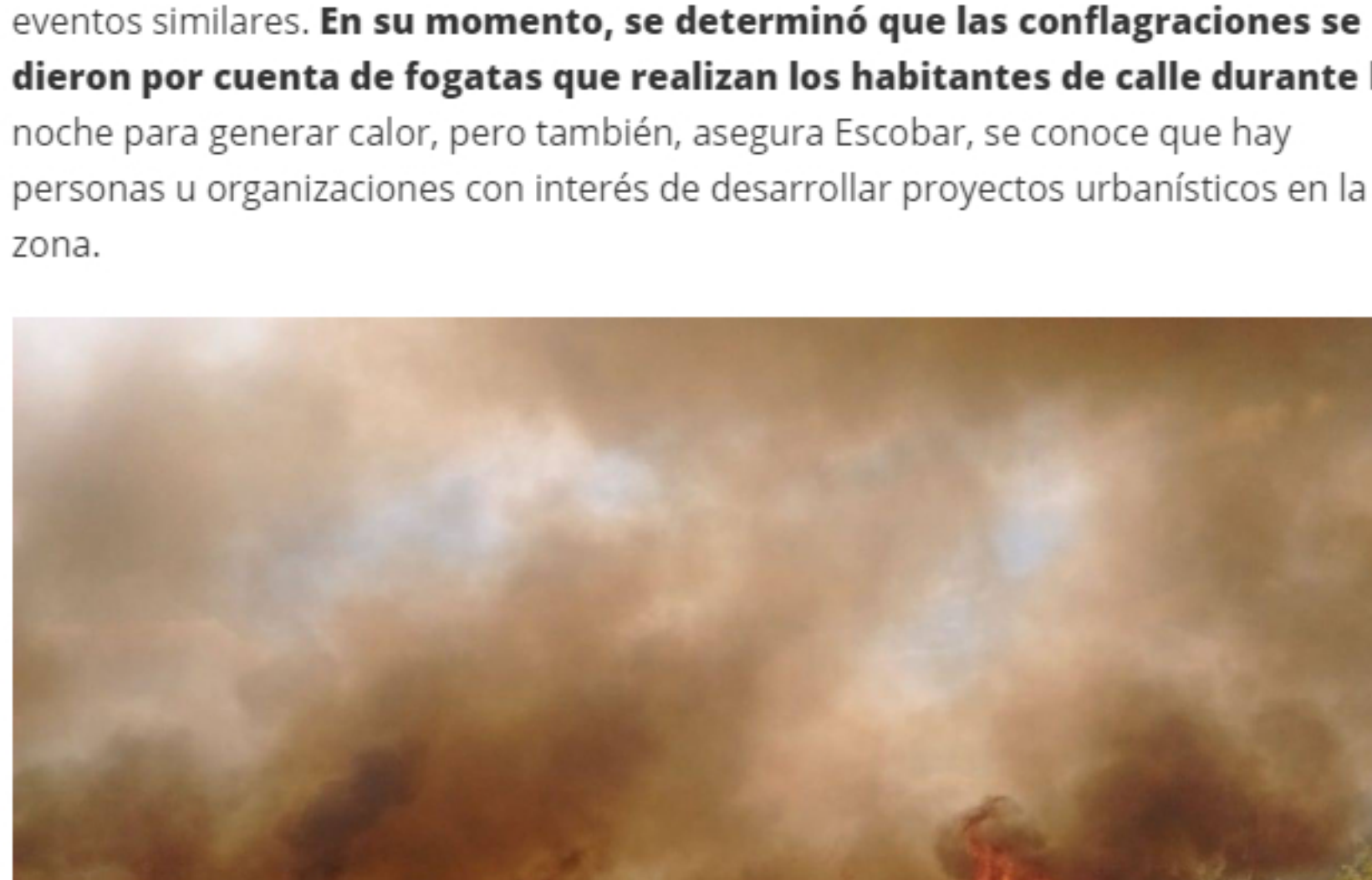
Así se ven las llamas en Humedal Tibanica.