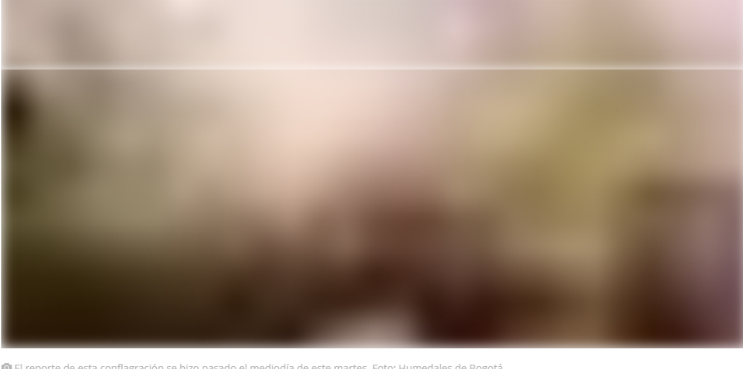
📷 El reporte de esta conflagración se hizo pasado el mediodía de este martes.

Es la segunda vez en este año que se presenta una emergencia por fuego en este ecosistema. En la mañana de este martes también se registró otro evento en el humedal de Techo. Ambos ya fueron controlados.