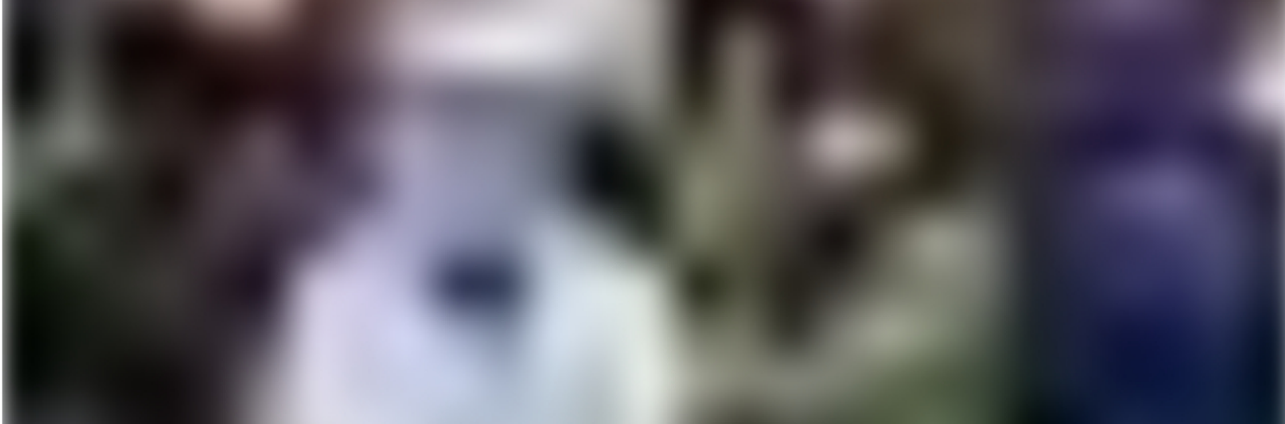
📷 El coronavirus ha disparado la compra de máscaras protectoras en varios países de Asia.

En solo 17 días las emisiones de gases de efecto invernadero se redujeron en 100 millones de toneladas en comparación con el mismo período el año pasado.