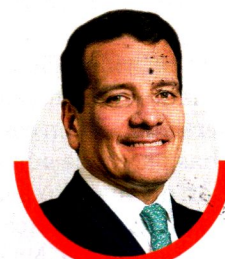
Felipe Bayón Presidente de Ecopetrol

"Y, por último, una que usamos mucho en Tappsi y Tpage es Google Drive, donde los documentos desde presentaciones o hojas de cálculo los puedes compartir con múltiples personas y cada uno puede editar o hacer comentarios en tiempo real.