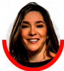
María Fernanda Suárez Ministra de Minas

"Por otro lado, las videollamadas las hacemos por Google Hangout. Me pareció, de lejos, la mejor herramienta para video llamadas, ya que su interfaz es muy fácil de usar. También odio que cuando hagas una videollamada tengas que descargar una aplicación y que el registro sea superengorroso. Con Hangout no tienes que descargar nada y el registro es en dos pasos.