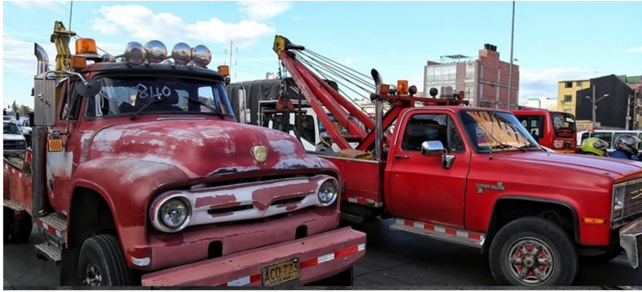
Transportadores de carga y volqueteros levantaron las movilizaciones en Bogotá.

La decisión se tomó luego de que se llegara a un acuerdo con el Distrito y el Ministerio de Transporte sobre las inconformidades generadas en el sector por el decreto 840.