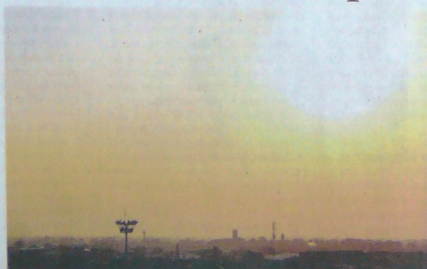
Este jueves Cali completó 24 horas con calidad del aire aceptable, de acuerdo con las 9 estaciones de monitoreo de la Universidad del Valle.

El Dagma, inició una evaluación exhaustiva de los reportes de las estaciones de medición con obtener información oportuna que permita tomar las acciones de protección.