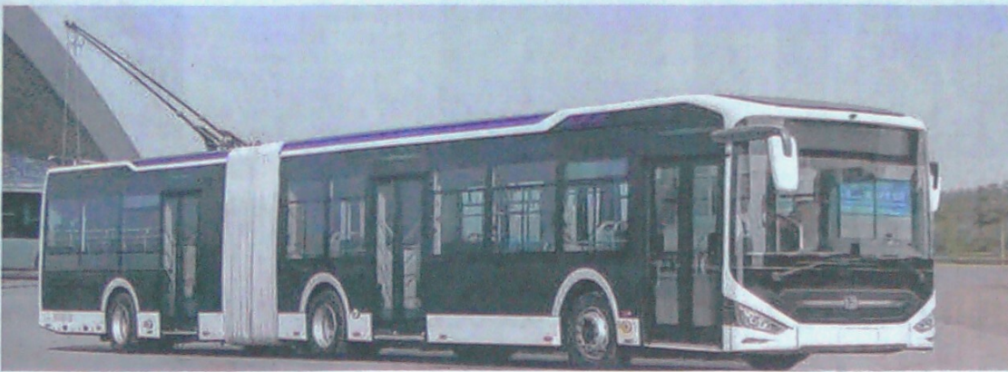
El tranviario que es un vehículo de tracción eléctrica que toma la corriente de cables aéreos. Estos vehículos circulan por carriles exclusivos parecidos a los del Sistema de Transporte Masivo. Los expertos dicen que son más económico que un tren.