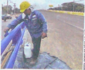
Actualmente se realizan últimos retoques al puente de Puerto Tejada.

El tranviario es un medio de transporte que opera en más de 320 ciudades del primer mundo varias de ellas en Alemania. En Latinoamérica opera en a, Sao Pablo, Valparaíso y Montevideo.