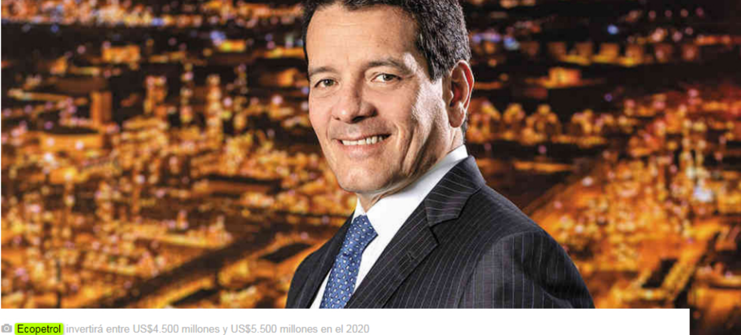
Ecopetrol invertirá entre US$4.500 millones y US$5.500 millones en el 2020

La petrolera estatal reveló cómo será su plan de inversiones para el año entrante. Le van a apostar al aumento de la rentabilidad y a la transición energética.