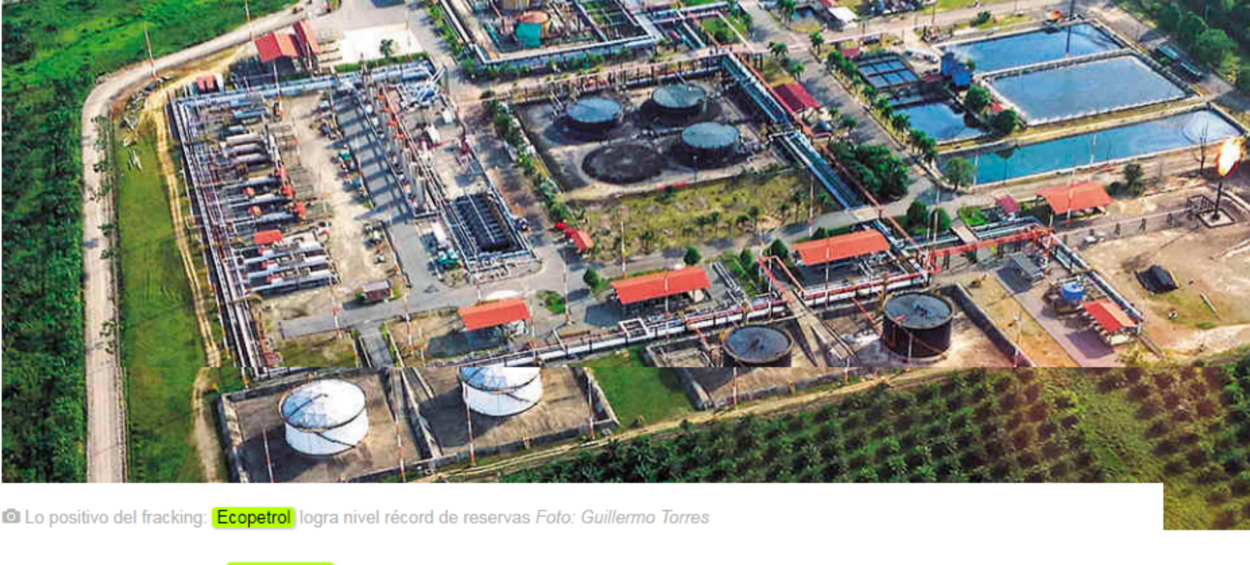
Lo positivo del fracking: Ecopetrol logra nivel récord de reservas

La estatal petrolera informó que en 2019 aumentó sus reservas probadas de hidrocarburos a 1.893 millones de barriles equivalentes. Esto gracias a su ingreso al negocio de los no convencionales en Estados Unidos.