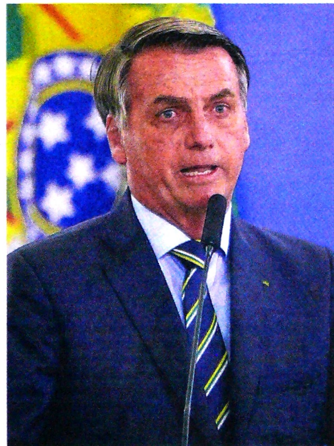
El alza fue de 20,4% en el país que preside Bolsonaro.

Río de Janeiro, estado en el que se encuentran ubicados los campos de Lula y Búzios, los más productivos del presal, fue la región de Brasil que más extrajo petróleo y gas natural durante el 2019, con una cuota total del 71% del volumen total producido en el país, lo