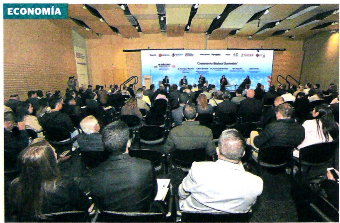
El tercer diálogo de China-Colombia se realizó en Bogotá y contó con el apoyo de Portafolio. César Melgarejo