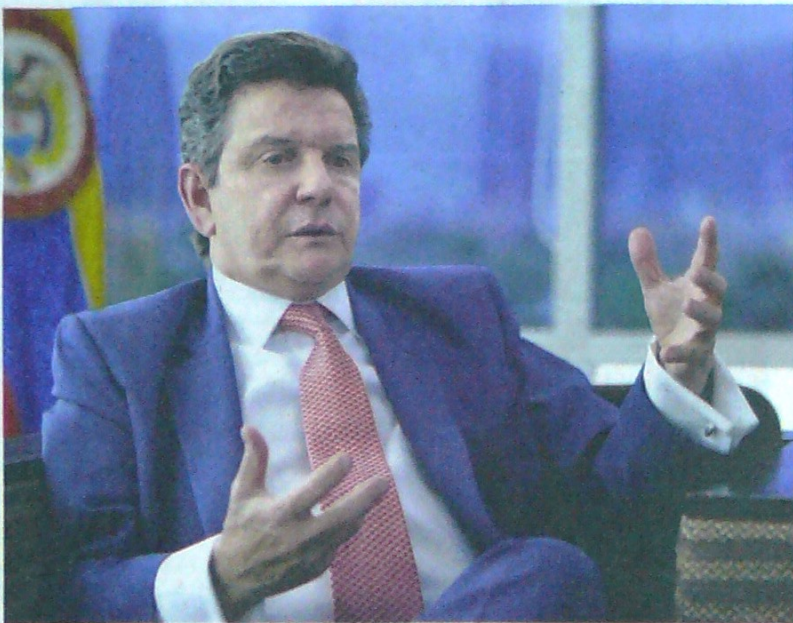
Además de haber trabajado en el sector de los hidrocarburos por más de 20 años, Luis Miguel Morelli fue gobernador de Norte de Santander entre los años 2003 y 2007.

El Centro Democrático no vio con buenos ojos decisión del Gobierno respecto del presidente de la ANH.