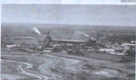
Cerro Matoso dijo que prepara su defensa.

La compañía, que dijo que está preparando su defensa, también refirió que es "inconstitucional" que prenda el cobro retroactivo de regalías por contratos finalizados.