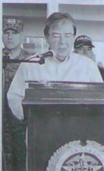
Carlos Holmes Trujillo, ministro de Defensa.

La Fiscalía coordina ahora el traslado de los cuerpos de todas las víctimas a la sede del Instituto de Medicina Legal y Ciencias