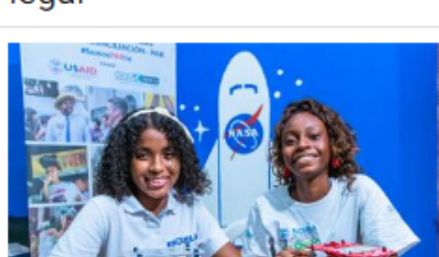
Dos niñas de Chocó irán a la NASA