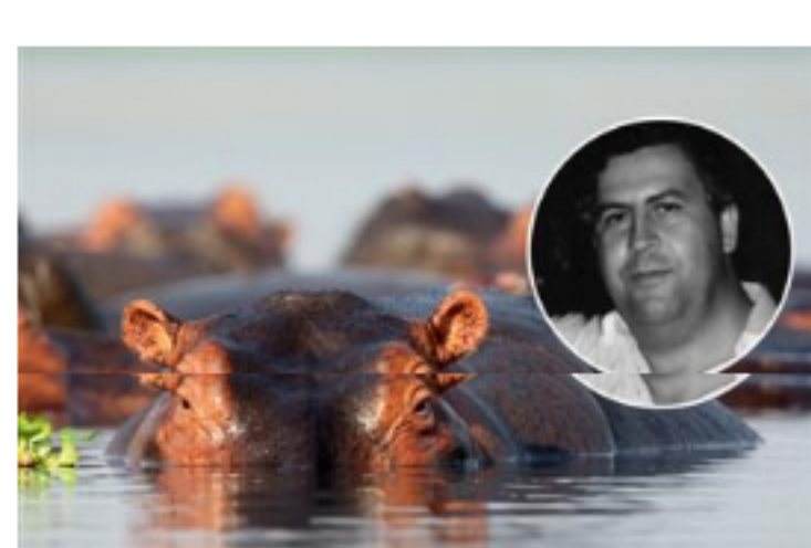
Los hipopótamos de Pablo Escobar podrían traer...