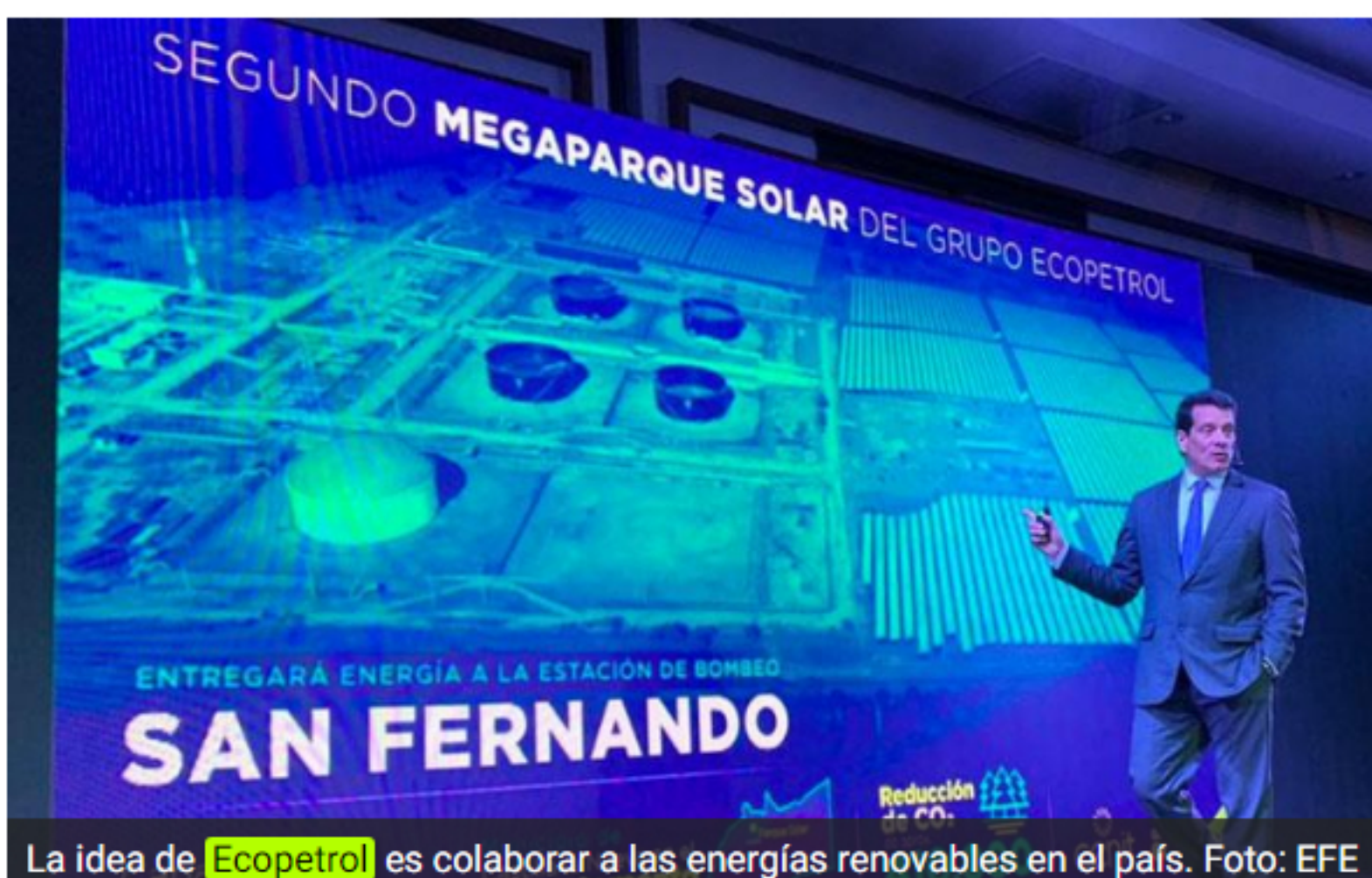
La idea de Ecopetrol es colaborar a las energías renovables en el país.

Según Ecopetrol , se evitará la emisión de más de 410.000 toneladas de dióxido de carbono a la atmósfera durante los próximos 15 años.