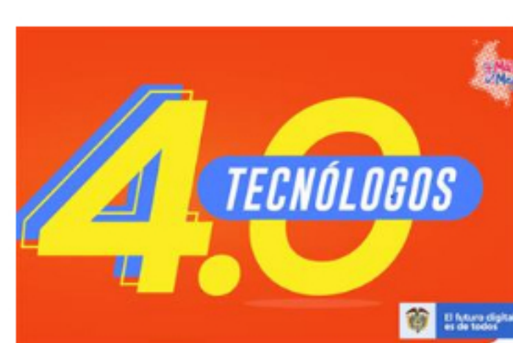
MinTIC abre convocatoria de becas para tecnologías en...