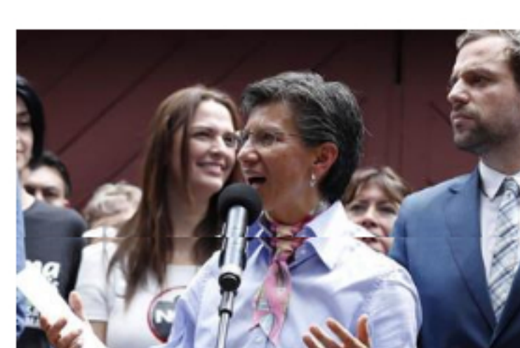
"Desde la Alcaldía apoyamos esa postura": Claudia López...