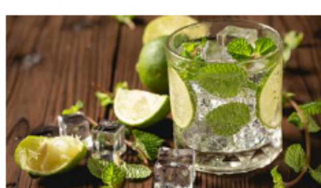
Descubre todo lo que puede hacer por ti el agua con limón en ayunas

Todo lo que debes saber sobre el uso de los esmaltes semipermanentes