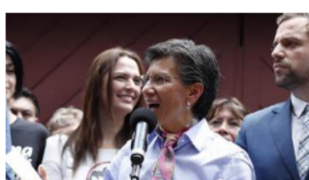
"Desde la Alcaldía apoyamos esa postura": Claudia López sobre aborto legal