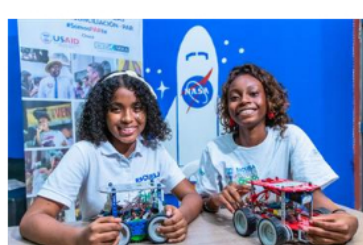
Dos niñas de Chocó irán a la NASA