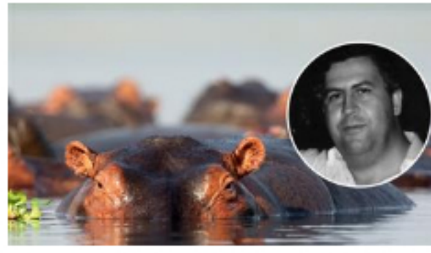
Los hipopótamos de Pablo Escobar podrían traer problemas ambientales a Colombia