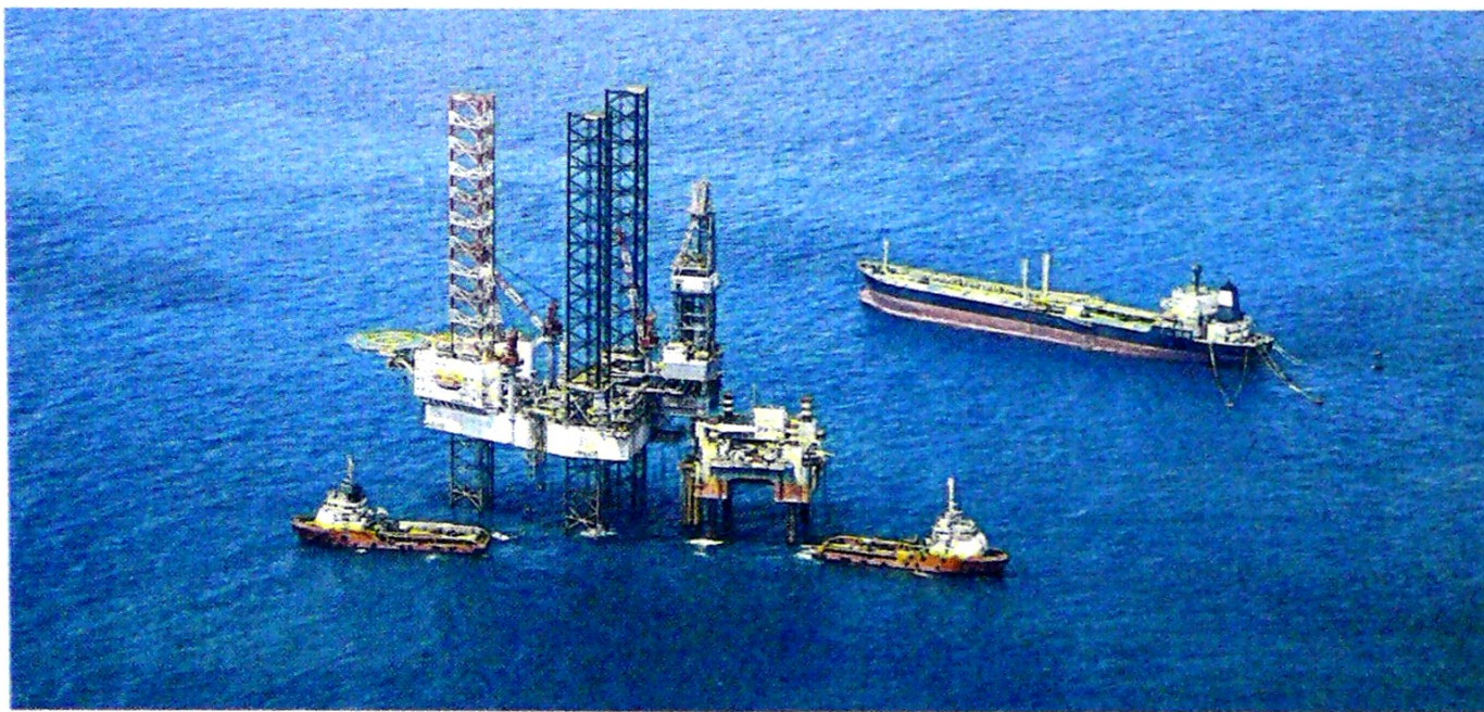
Con la firma de cinco contratos E&P, para la operación costa afuera, contribuyó a reactivar el sector petrolero del país.

La dinámica del sector minero energético quedó demostrado con el PIB (2019) que reflejaron un crecimiento de 3,3%”.