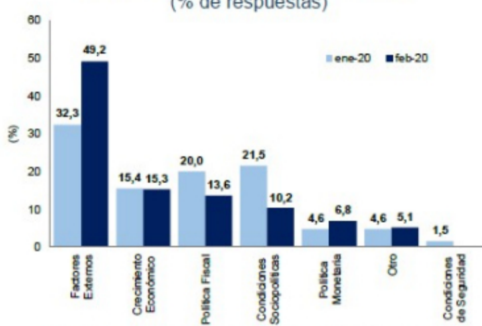
Gráfico 10. Factor más relevante para tomar decisiones de inversión (% de respuestas)

Las condiciones socioeconómicas se ubicaron en el cuarto puesto del ranking, con el 10,2% de la participación de los encuestados (21,5% en el mes pasado).