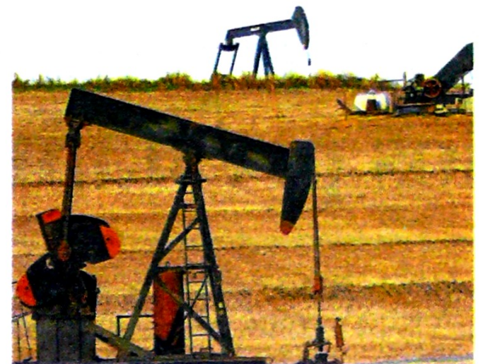
En 2020, el virus frenará el aumento del consumo en 30%.

sobre estas nuevas acusaciones. Desde hace tiempo, el Gobierno de EE. UU. considera que los productos de la empresa china representan un riesgo para la seguridad, debido a sus vínculos muy estrechos con el Ejecutivo chino.