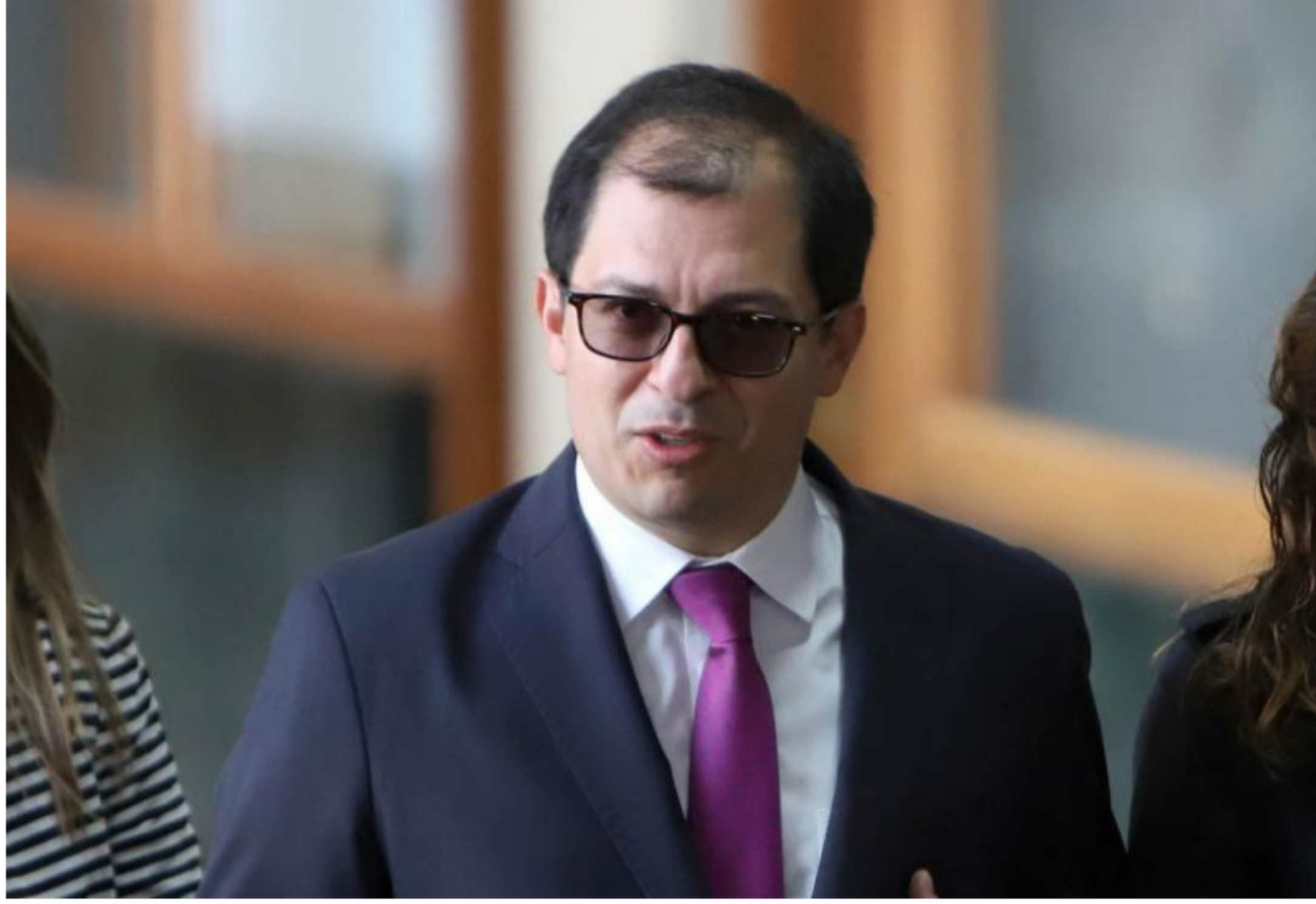
Francisco Barbosa / Fiscalía General de la Nación