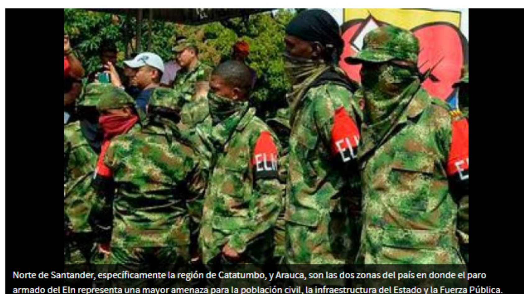
Norte de Santander, específicamente la región de Catatumbo, y Arauca, son las dos zonas del país en donde el paro armado del Eln representa una mayor amenaza para la población civil, la infraestructura del Estado y la Fuerza Pública.

COLPRENSA | @EIUniversalCtg | 13 de febrero de 2020 08:08 AM |