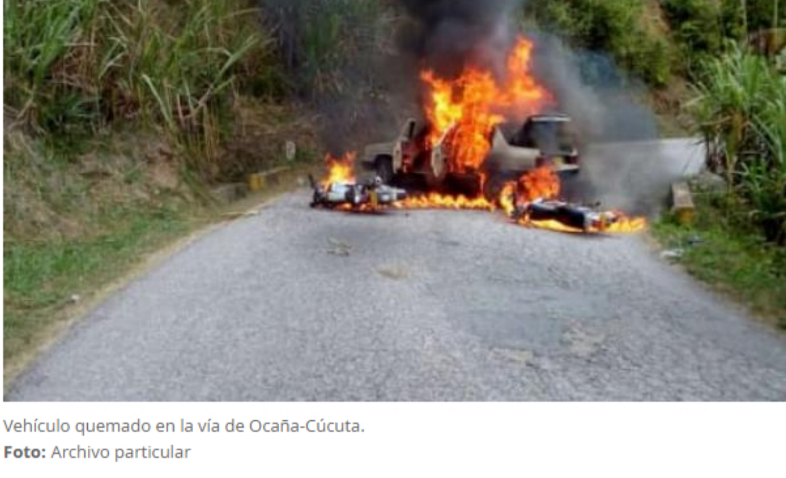
Vehículo quemado en la vía de Ocaña-Cúcuta.

(También lea: Carro bomba explotó en Puerto Rondón, Arauca )