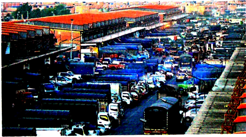
Más de 1.300 camiones con ulteres ingresaron ayer a Corabastos.

A estos automotores se suman los de menos de 10 toneladas y que son los que traen a la capital los alimentos que se producen en el Meta, Casanare, Boyacá, Cundinamarca y la Sabana. Solo ayer ingresaron a Corabastos, la más grande central de abastos