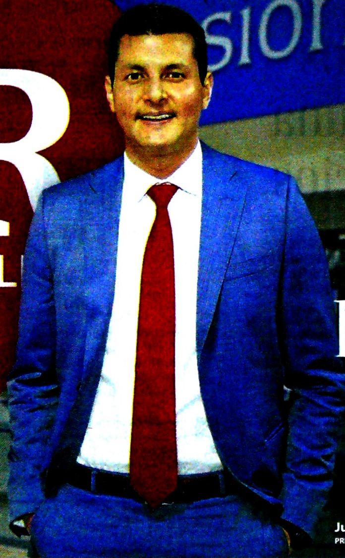
Juan Miguel Villa PRESIDENTE DE COLPENSIONES

LABORAL. EN MESADAS, COLPENSIONES PAGA $2,5 BILLONES MENSUALES