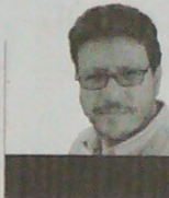
Ambos mundos SANTIAGO GAMBOA