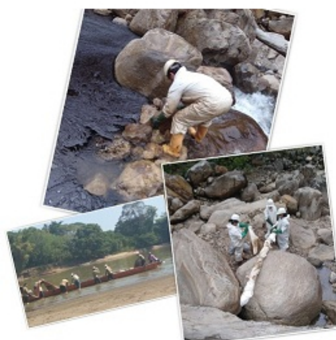
Derrame de petróleo