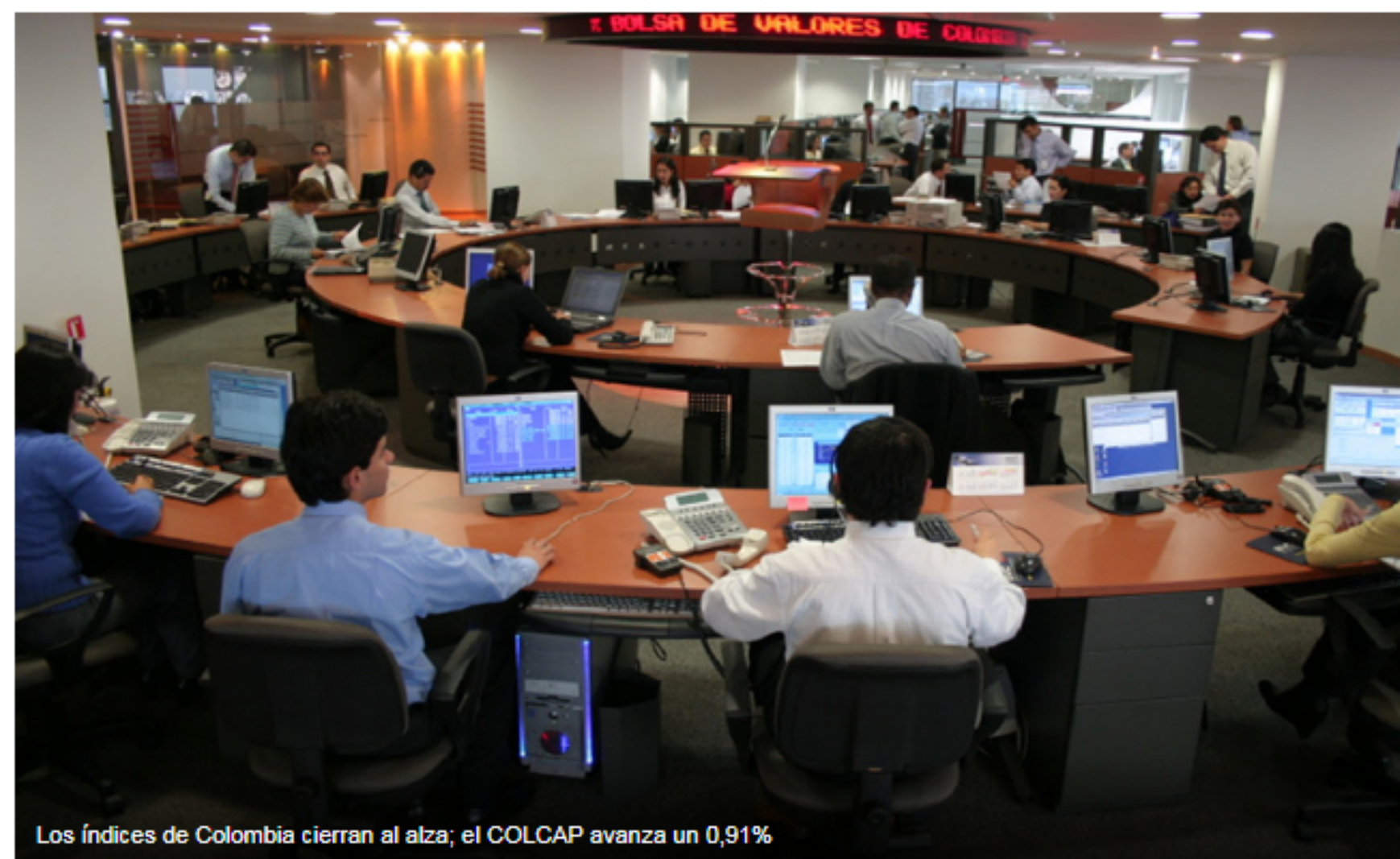
Los índices de Colombia cierran al alza; el COLCAP avanza un 0,91%

Investing.com – La Bolsa de Colombia cerró con avances este miércoles; las ganancias de los sectores agricultura , COL Inversionist , y servicios públicos impulsaron a los índices al alza.