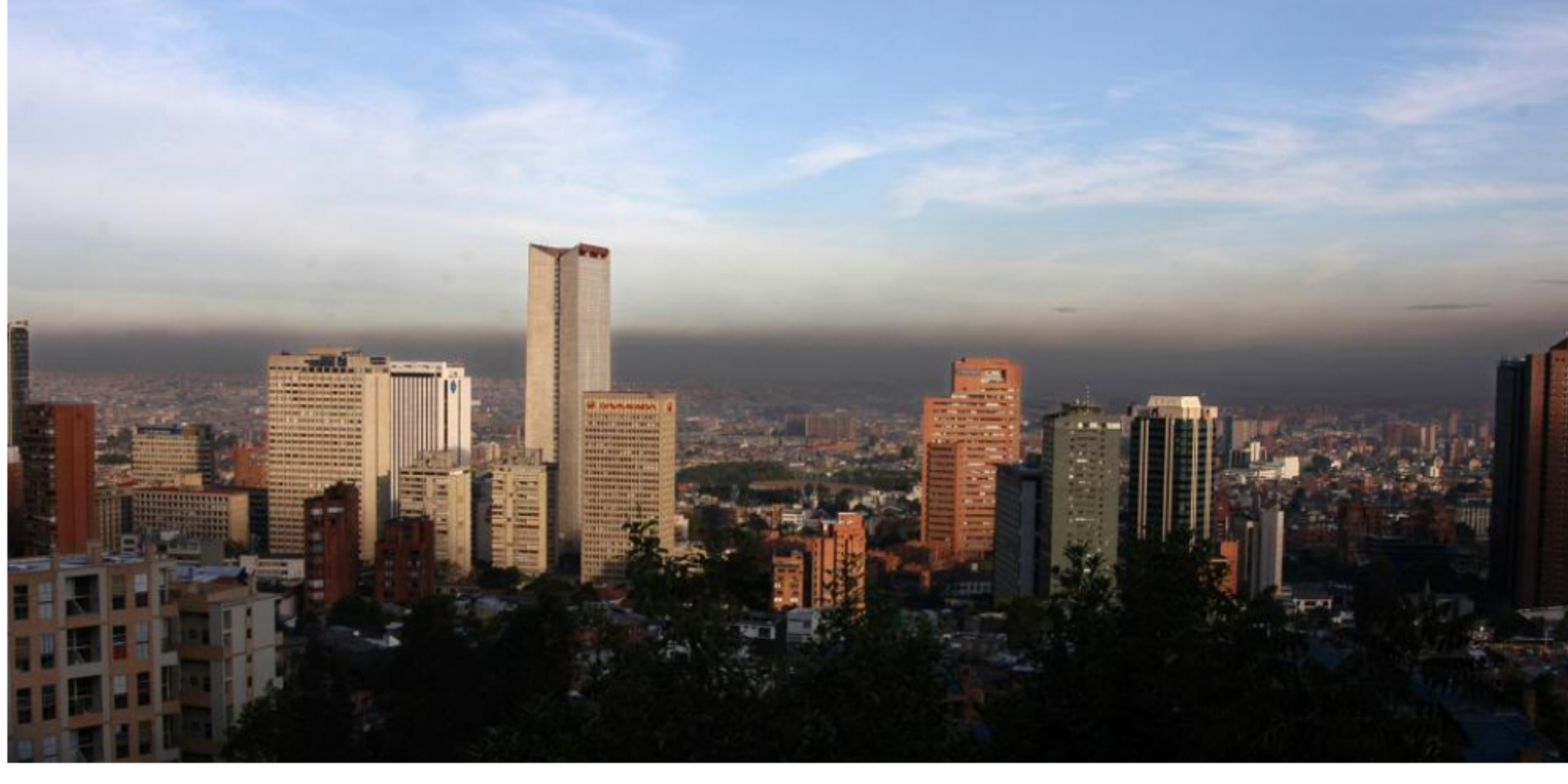
Contaminación en Bogotá.

RELACIONADOS: BOGOTÁ | SECRETARÍA DE AMBIENTE | AIRE | CALIDAD DEL AIRE