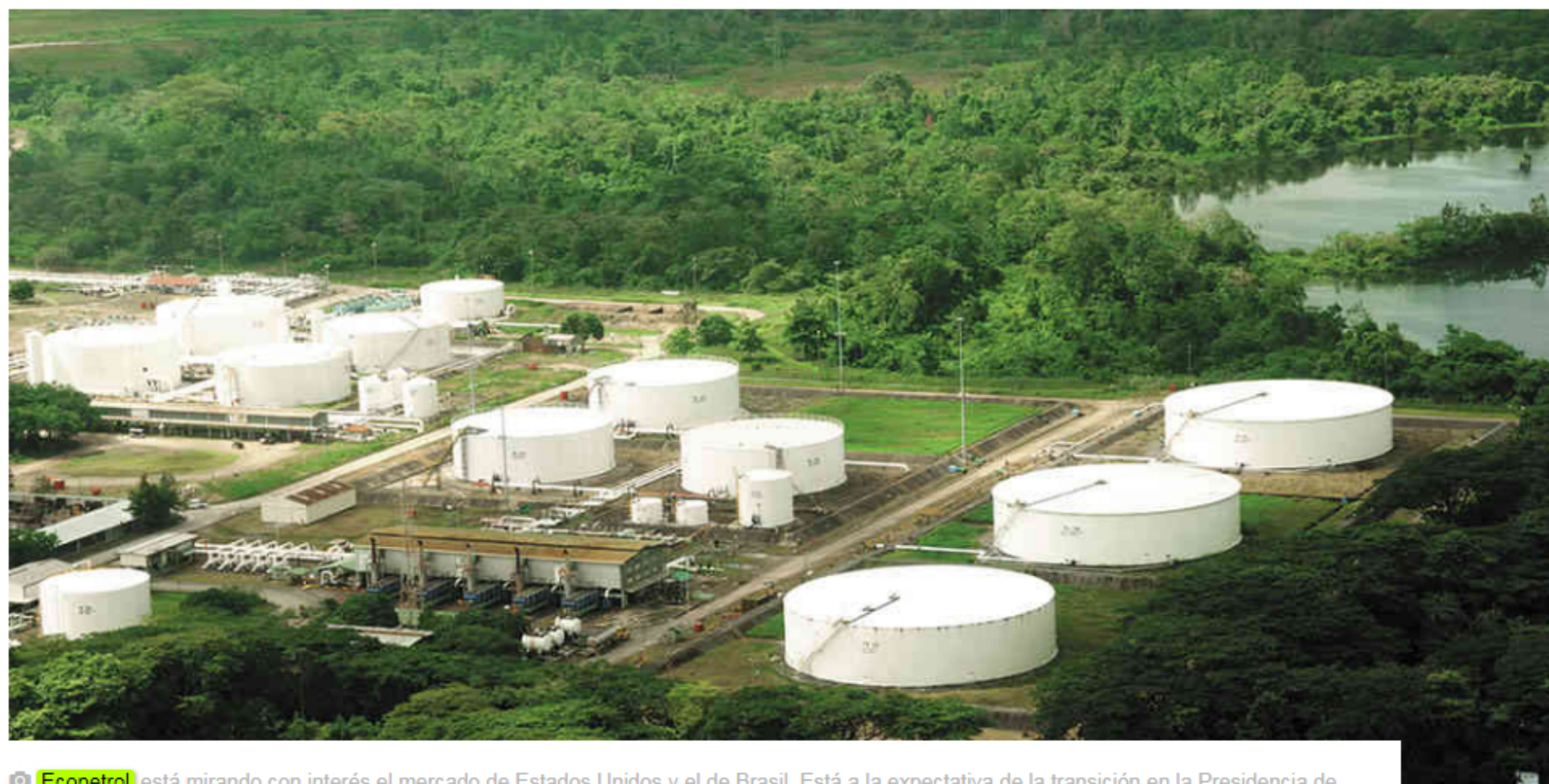
Ecopetrol está mirando con interés el mercado de Estados Unidos y el de Brasil. Está a la expectativa de la transición en la Presidencia de México.

Los resultados financieros de Ecopetrol le han permitido contar con una caja de $18,1 billones, que pueden ser una tentación para el Gobierno, su máximo accionista. ¿Qué va a hacer la empresa con esos recursos?