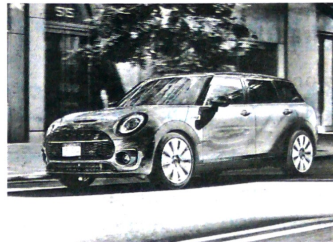
La marca sigue renovando su portafolio.