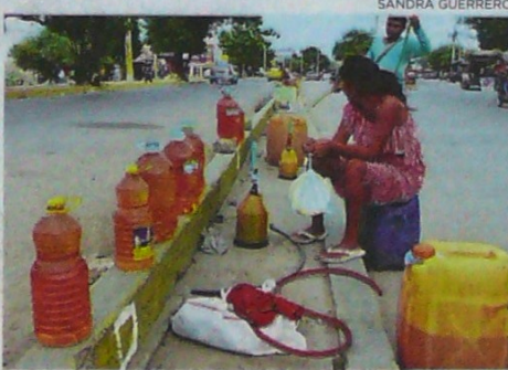
La venta de la gasolina de Venezuela es en plena vía.

"No entendemos cuáles son las razones para que se dé esta situación que nos ubica en una situación de desigualdad económica y competitiva frente a los demás distribuidores minoristas del resto del país e impide que se pueda mejorar la calidad del servicio en un departamento con