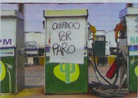
Son en total 195 estaciones de servicio en paro.

condiciones y características diferenciadas a las de las demás regiones del país", argumentan los propietarios de las EDS.