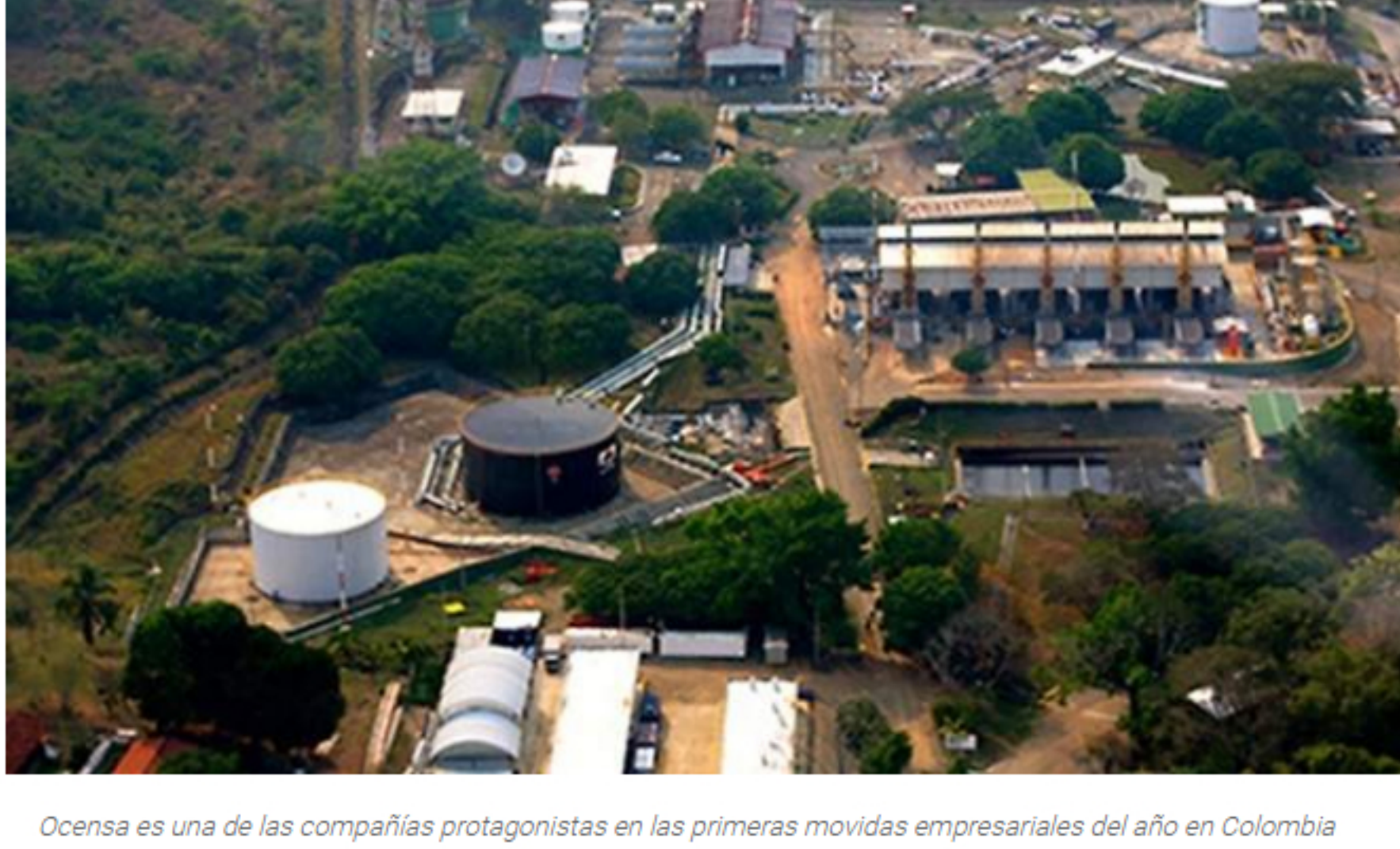
Ocesa es una de las compañías protagonistas en las primeras movidas empresariales del año en Colombia

* Se incrementa actividad de integraciones, cambios de dueños y alianzas comerciales de las empresas colombianas.