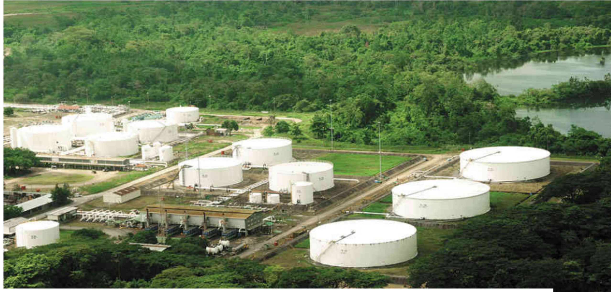
Ecopetrol está mirando con interés el mercado de Estados Unidos y el de Brasil. Está a la expectativa de la transición en la Presidencia de México.

Los resultados financieros de Ecopetrol le han permitido contar con una caja de $18,1 billones, que pueden ser una tentación para el Gobierno, su máximo accionista. ¿Qué va a hacer la empresa con esos recursos?