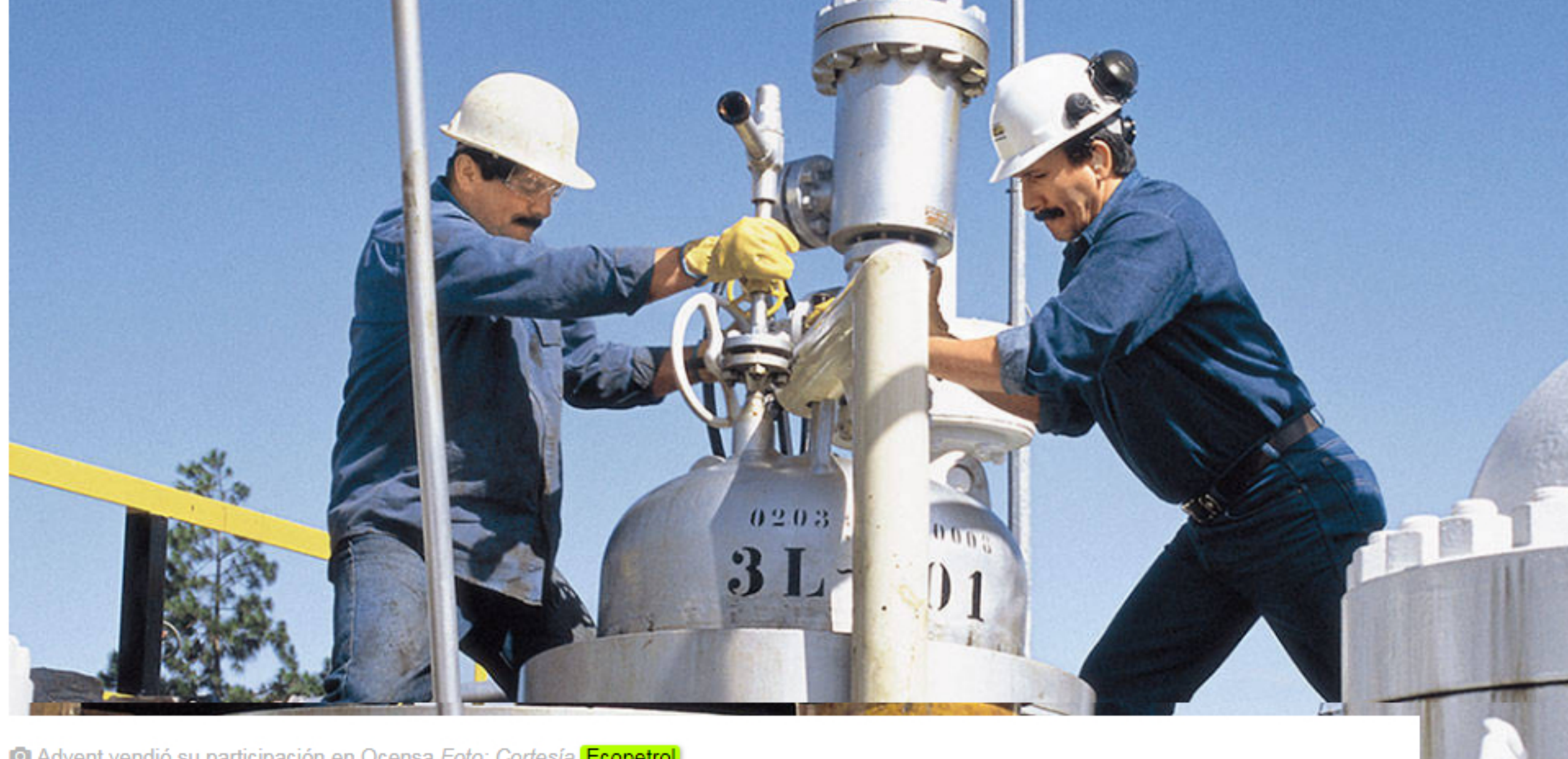
Advent vendió su participación en Ocesa

El Fondo Advent International dio a conocer que vendió su participación en Oleoducto Central S.A. (Ocesa).