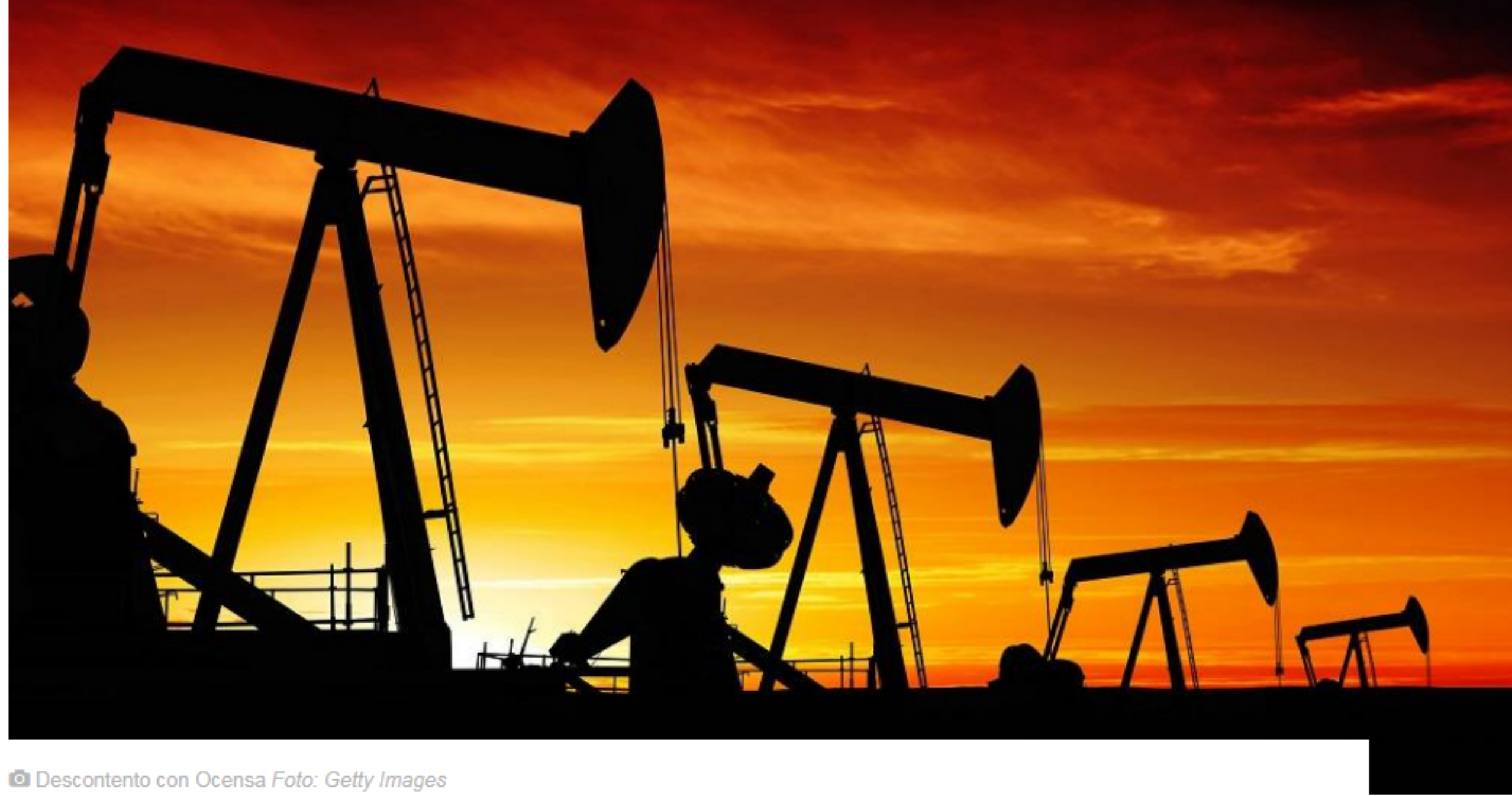
Descontento con Ocesa

Algunas compañías petroleras mostraron su insatisfacción por el incremento en las tarifas del oleoducto de Ocesa, el más importante del país, por donde transportan el 60% del crudo nacional. Ya hay una carta de la Asociación Colombiana del Petróleo (ACP) al Gobierno y una solicitud de investigación a la Superintendencia de Industria y Comercio (SIC). Además, hay una señal de alerta: el estudio que fundamenta el incremento tarifario advierte sobre una caída abrupta en la producción de crudo cercana a 30%. El asunto dejó perplejos a muchos en la industria y exige una respuesta del Gobierno.