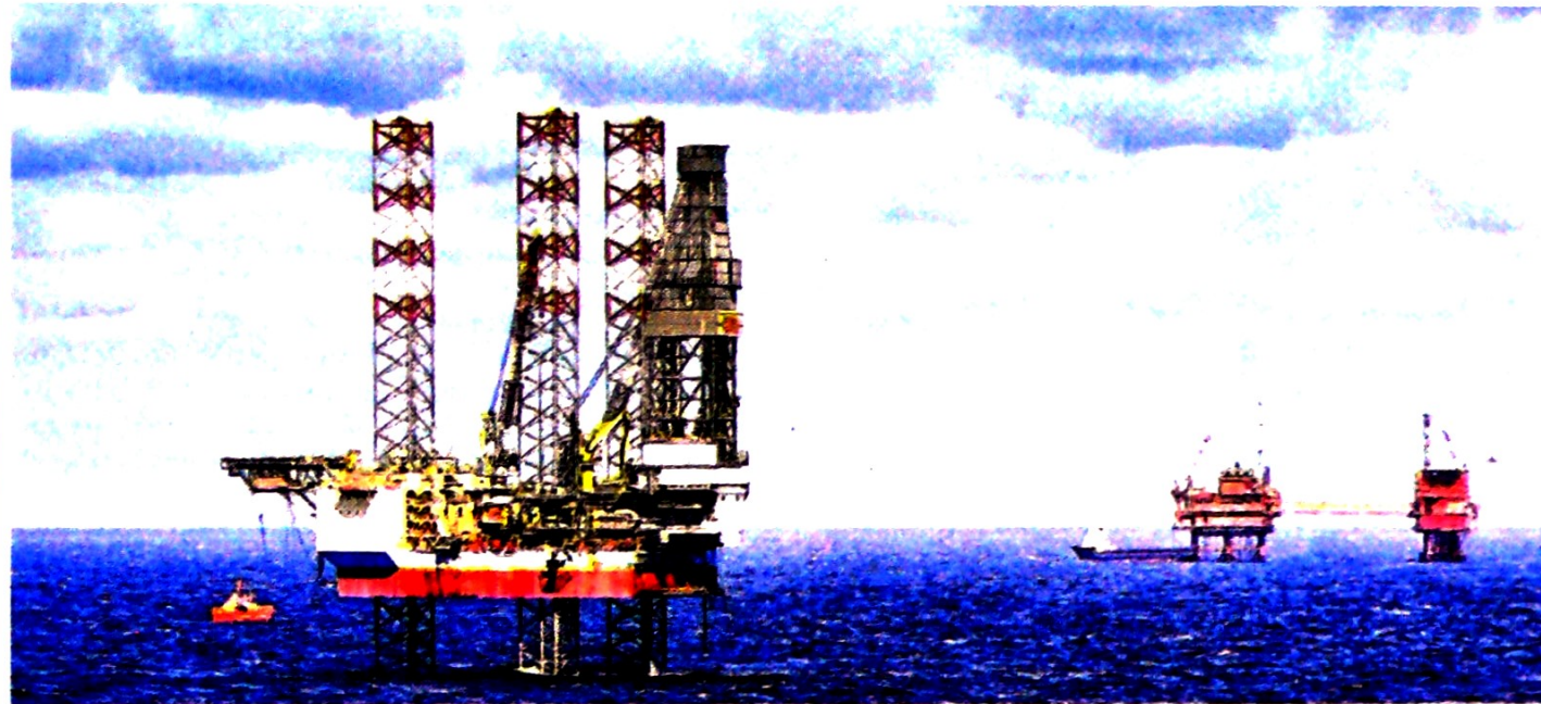
En total, Ecopetrol tiene presencia en seis bloques exploratorios ubicados en aguas del mar Caribe colombiano.

En su estrategia de seguir ampliando la operación