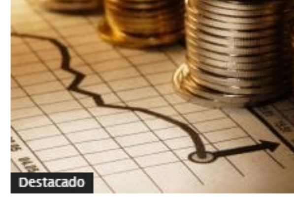
Extranjeros y Gobierno, mayores compradores de deuda de Colombia en enero