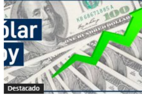
Dólar en Colombia alcanzó nuevo máximo de 2020