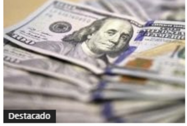
Gobierno de Colombia inició el 2020 siendo comprador de dólares