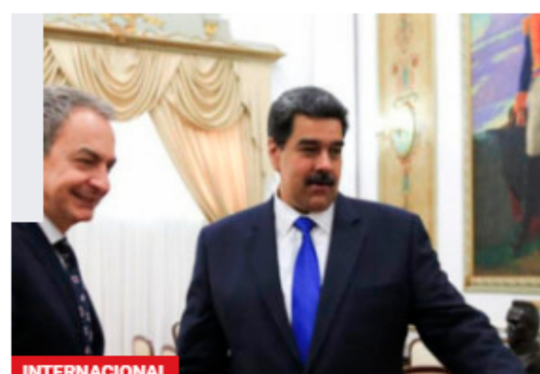
INTERNACIONAL Visita de Rodríguez Zapatero a Venezuela revive discusiones sobre mesa de diálogo