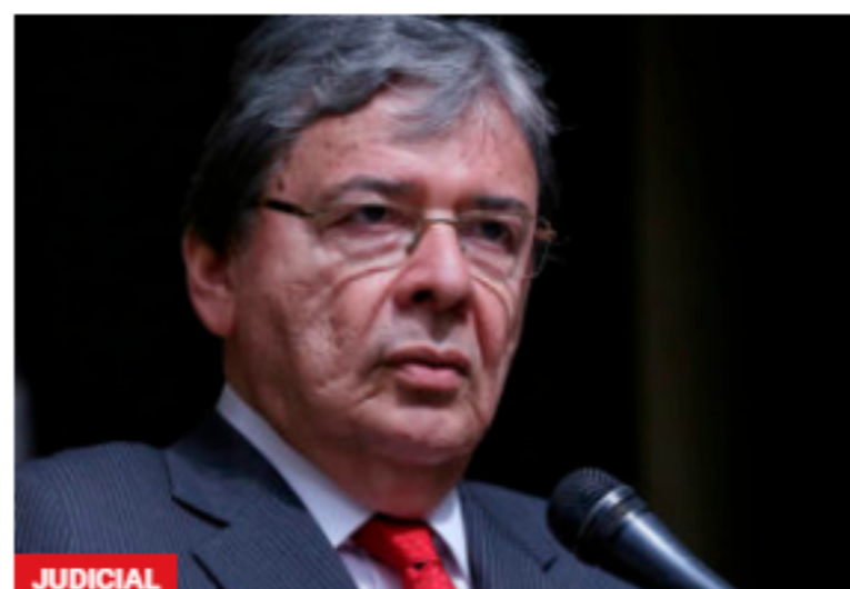
JUDICIAL La reacción del gobierno al anuncio del paro armado en el país