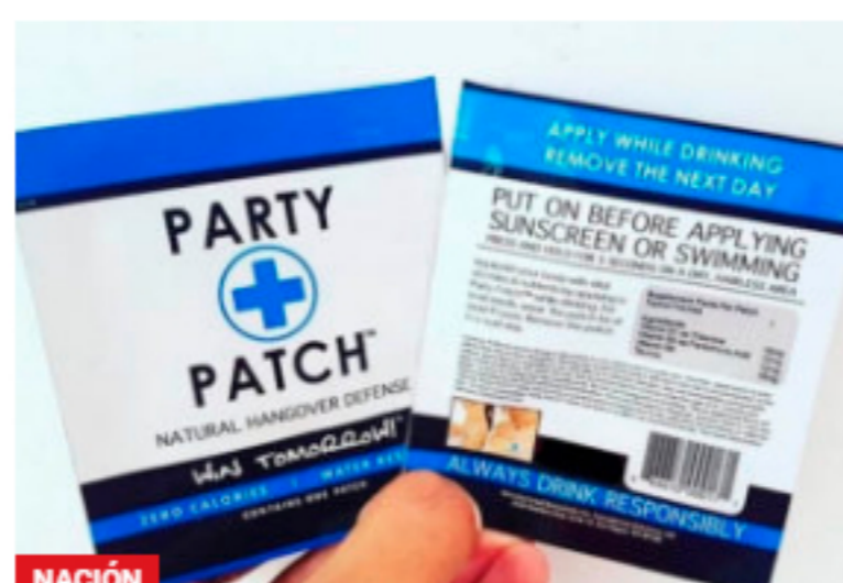
NACIÓN Alertan por uso de parche anti guayabo en el país