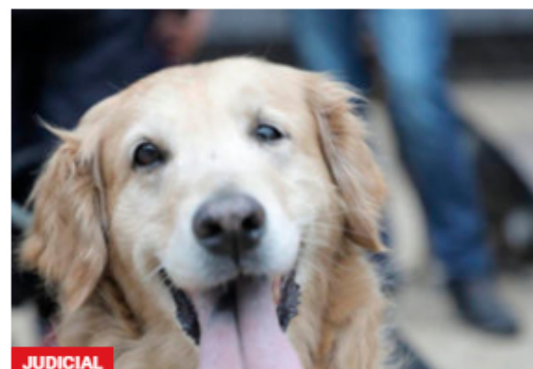
JUDICIAL Procuraduría sale en defensa del Código de Policía sobre perros guía