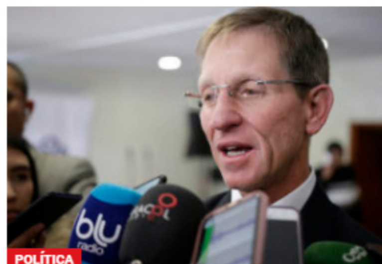
POLÍTICA Fondo multidonante de la ONU aportará usd 24,5 millones para acuerdo de paz