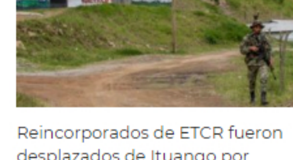
Reincorporados de ETCR fueron desplazados de Ituango por amenazas