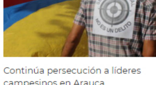
Continúa persecución a líderes campesinos en Arauca