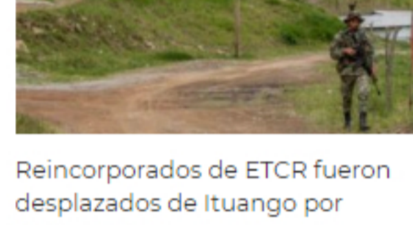
Reincorporados de ETCR fueron desplazados de Ituango por amenazas