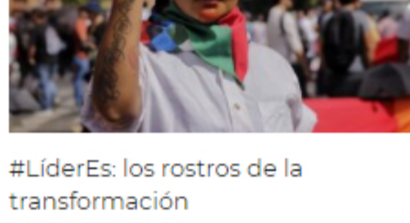
#LiderEs: los rostros de la transformación