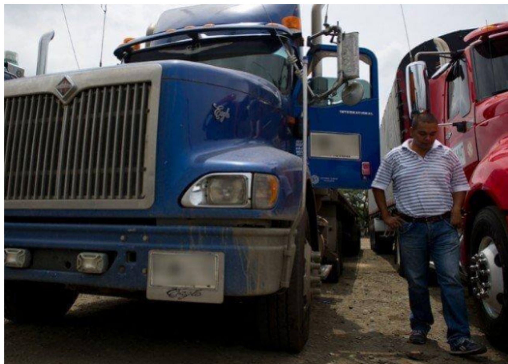
BLU Radio. Camioneros

El Gobierno argumentará que ya está listo el decreto para modernizar vehículos de carga de más de 20 años, con lo que se reducirán afectaciones a la salud y el medio ambiente.