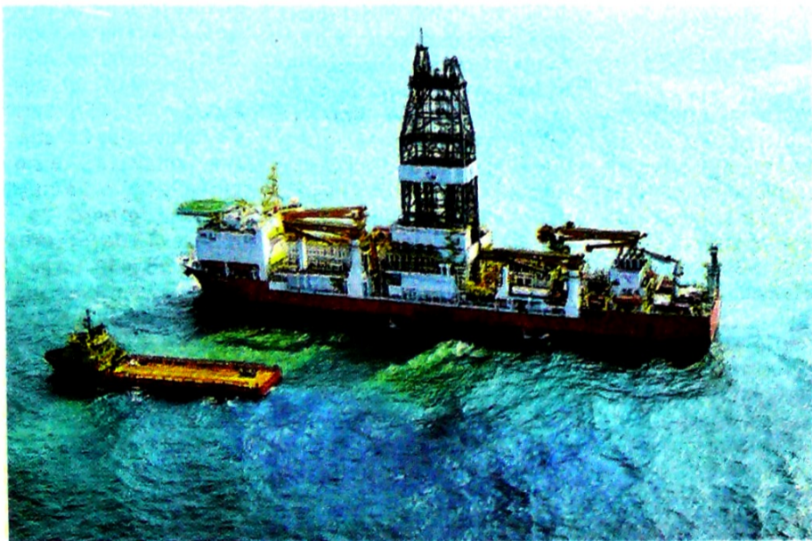
En 2017, tras la perforación de los pozos Purple Angel y Gorgon, Ecopetrol informó del hallazgo de una provincia gasífera, a la cual se vinculará la holandesa Shell.

La petrolera angloholandesa adquirirá el 50 % de tres bloques, asumiendo su operación. En 2021 perforarán pozo delimitador.