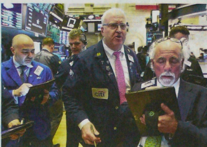
Entre las 30 acciones cotizadas en el indicador Dow Jones de Wall Street solo avanzaron cinco, entre ellas Verizon, United Technologies y Coca Cola

Las Bolsas en Asia continúan siendo afectadas por el virus, a medida que aumentan las noticias sobre su propagación. Por ejemplo, en Japón continúan atentos a los casos que se confirman en el crucero retenido con más de 3.000 personas, mientras que Fox-