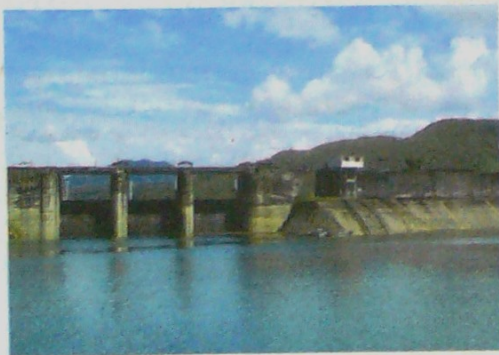
Los embalses en el Valle del Cauca se encuentran al 58 % de su capacidad, según informó la compañía XM

Según XM, en promedio, durante el mes de enero, la generación de energía fue de 193,3 Gigavatios hora/día. El 68,73 % de la generación, equivalente a 132,87 Gigavatios ho-